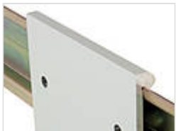
Metall-Hutschieneadapter für Tragschiene DIN EN 60715 TH 35