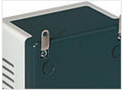
Wandlaschen, Stahlblech vernickelt