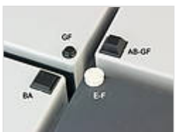
Universelle GummifüÙe für einen sicheren Stand der Gehäuse auf allen Flächen