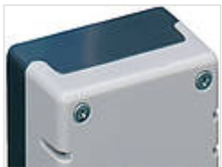
Deckelbefestigungssatz von oben