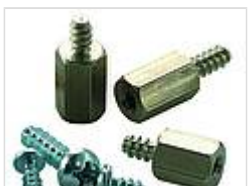
Schrauben (SHR) und Distanzbolzen (DIBLZ) für Montagenocken in Kunststoffgehäusen

Kautschuk, 67 Shore, für E 440-E 470, Weiß für E 434 S